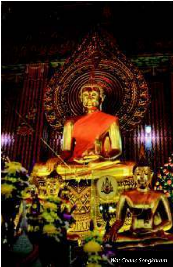
Wat Chana Songkhram