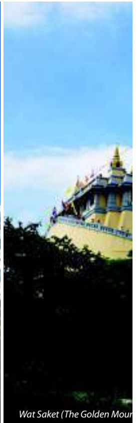
Wat Saket (The Golden Mountain)