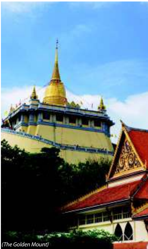
(The Golden Mount)

Orario di apertura: ogni giorno dalle 8.00 – 16.00