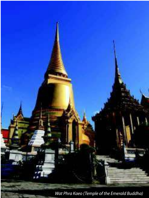
Wat Phra Kaeo (Temple of the Emerald Buddha)