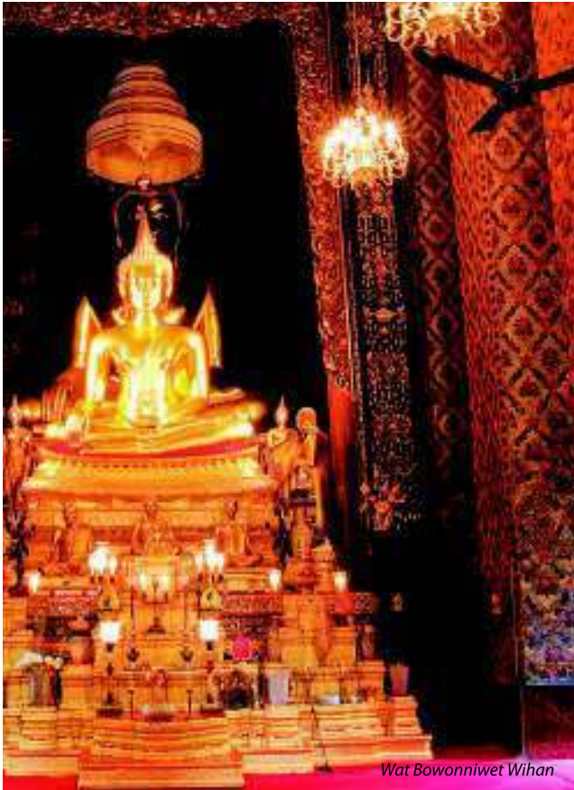
Wat Bowonniwet Wihan