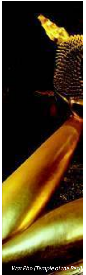
Wat Pho (Temple of the Reclining Buddha)