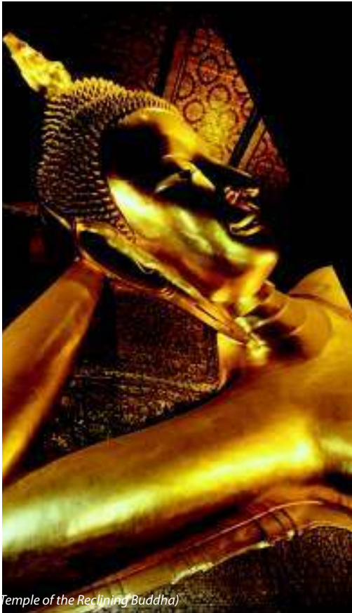
Temple of the Reclining Buddha)

Attrattiva principale: la gente crede che rendere omaggio alla statua del glorioso Phra Phutthachinnasi, l'antica statua che è stata modellata nel 957, faccia incontrare buona sorte nella vita.